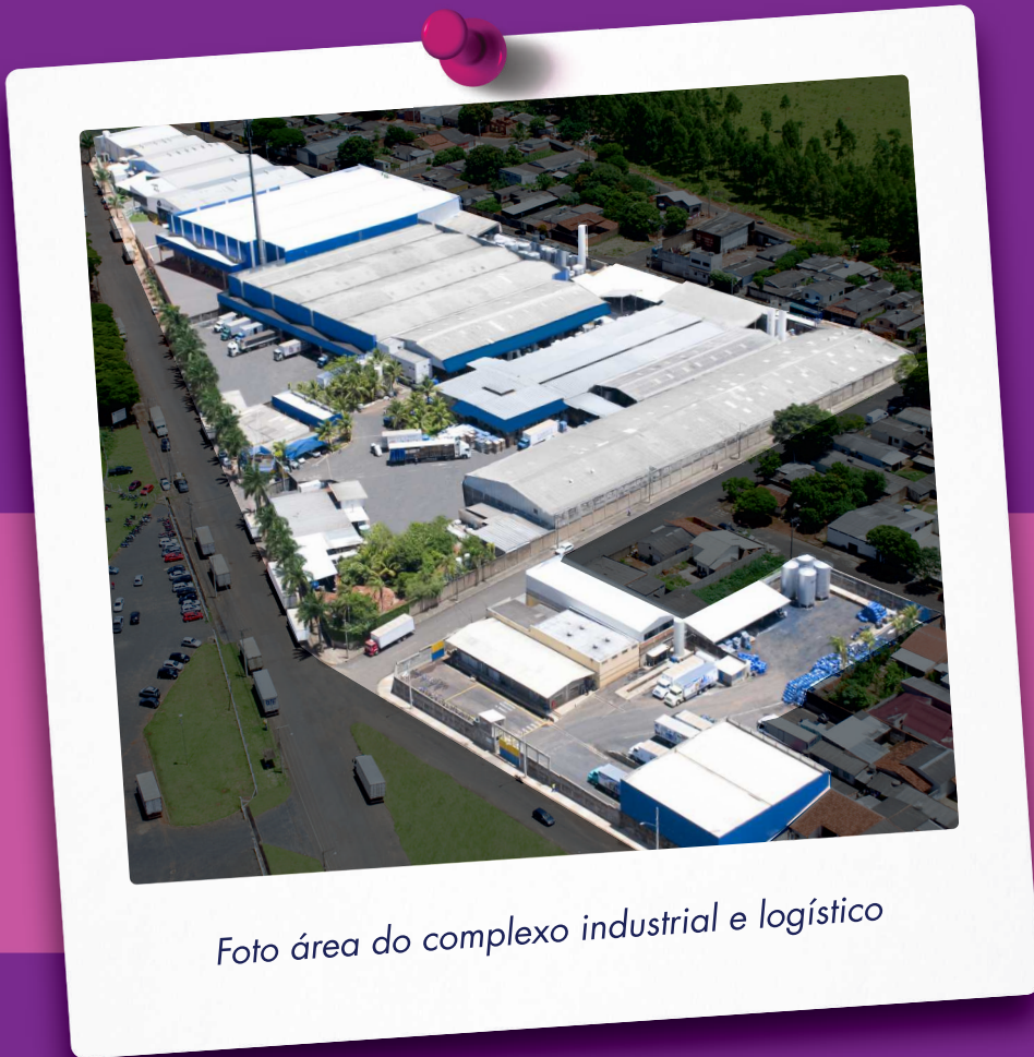
Foto área do complexo industrial e logístico

START. UMA HISTÓRIA POSSÍVEL COM PESSOAS EXTRAORDINÁRIAS.