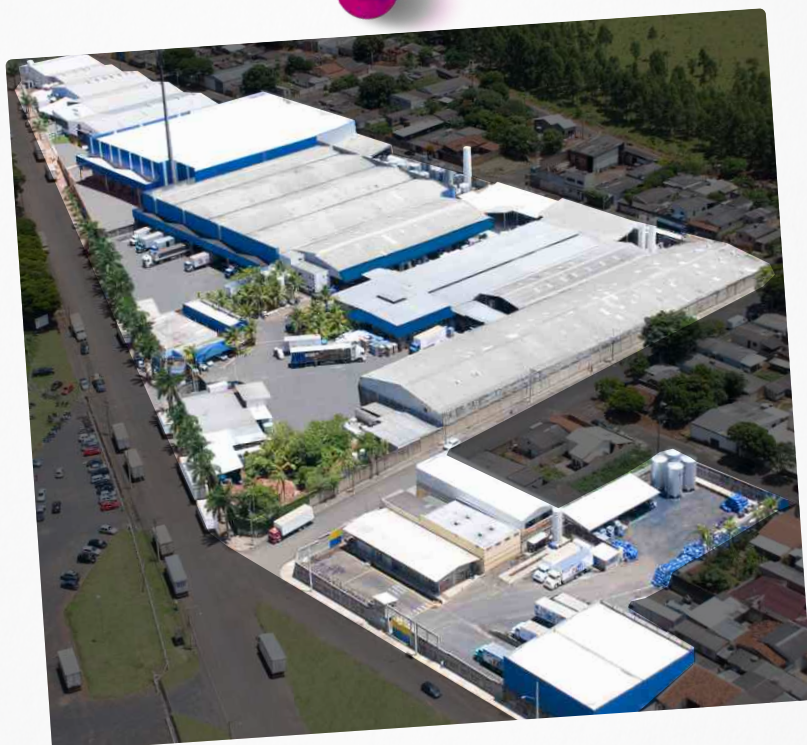
Foto área do complexo industrial e logístico

START. UMA HISTÓRIA POSSÍVEL COM PESSOAS EXTRAORDINÁRIAS.