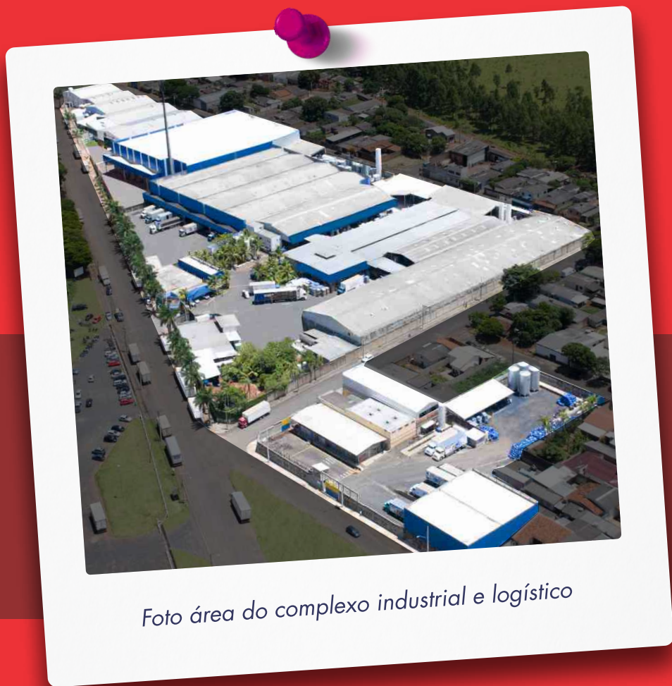
Foto área do complexo industrial e logístico

START. UMA HISTÓRIA POSSÍVEL COM PESSOAS EXTRAORDINÁRIAS.